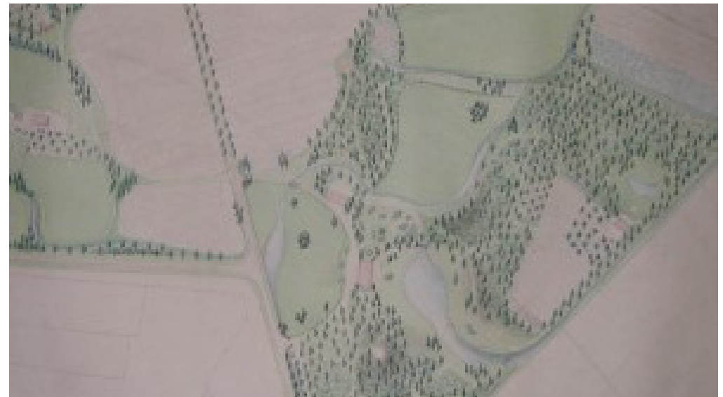
Ontwerp van H. van Lunteren