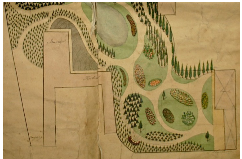
Ontwerp van L. Vlaskamp